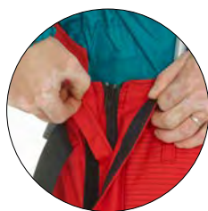
وجود دو لبه از زیپ محافظت میکند